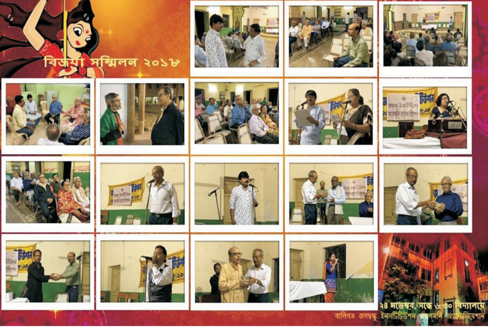
২৪ নভেম্বর, সন্ধ্যা ৬:৩০ বিদ্যালয়ে বাপিগঙ্গা জগদ্বন্ধু ইনস্টিটিউশন কলকাতা অধ্যক্ষসমিতি